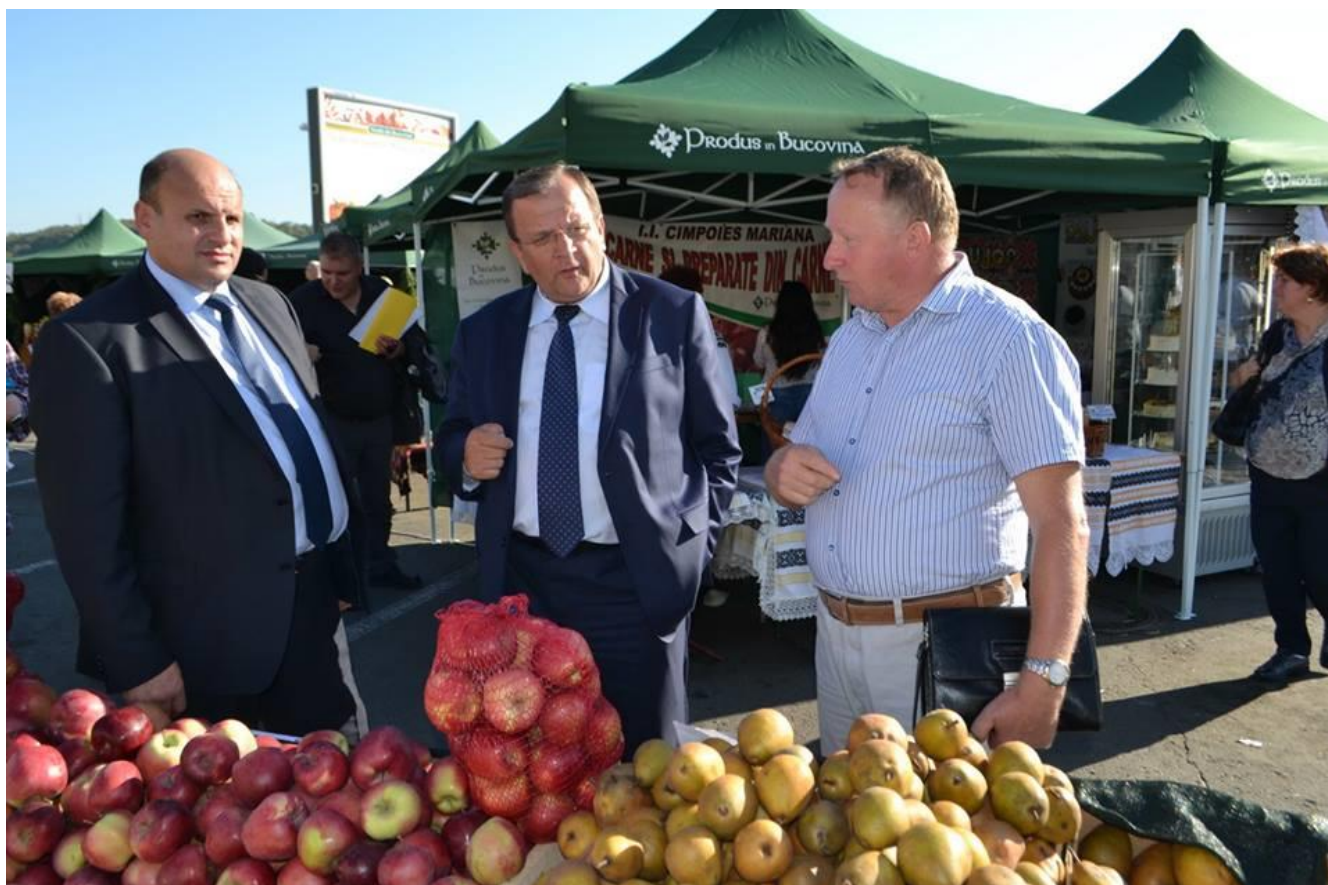
Alături de președintele CJ Suceava și de presedintele Regiunii Cernăuți din Ucraina la standurile pomicultorilor din Rădășeni, la târgul „Produs în Bucovina”