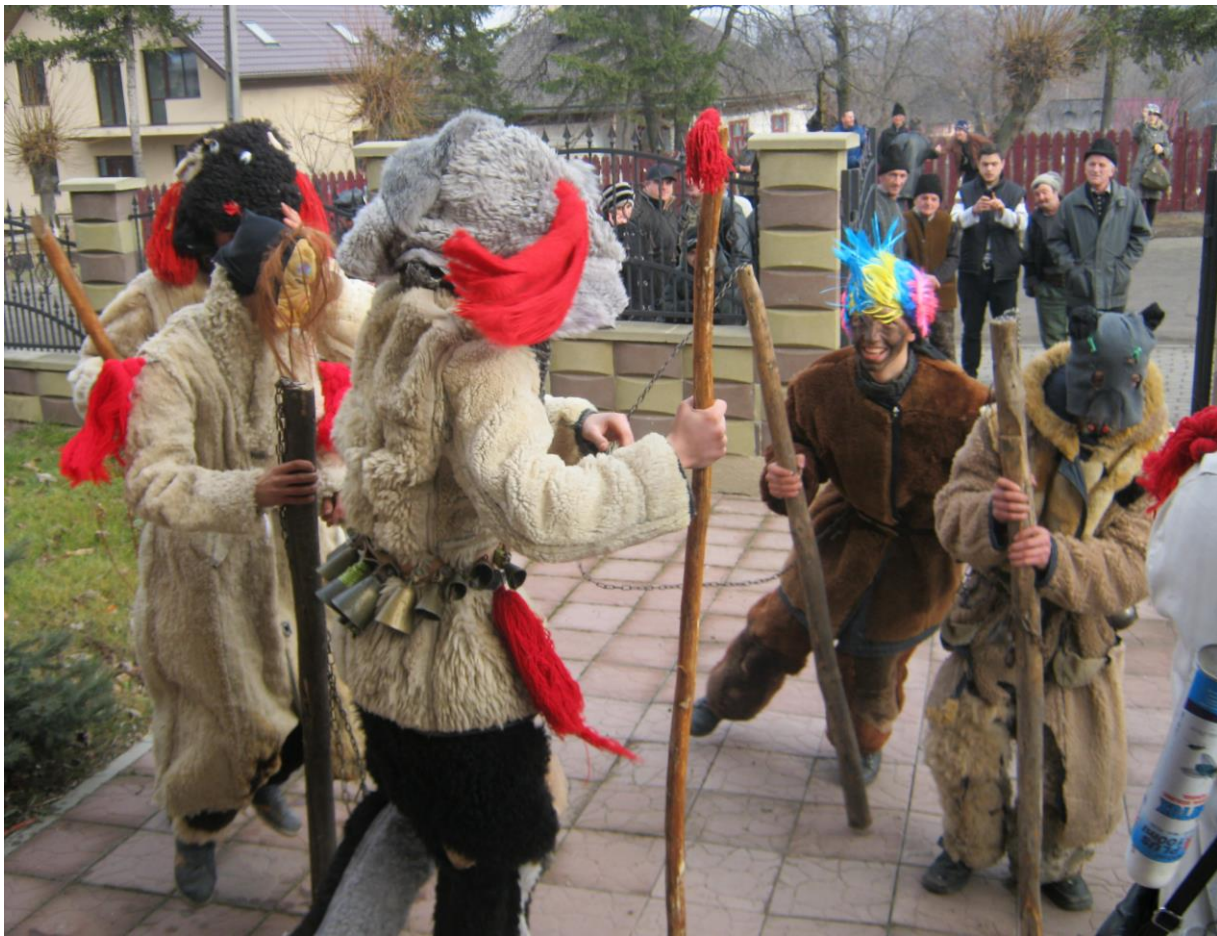
Urători în ajunul Anului Nou 2016