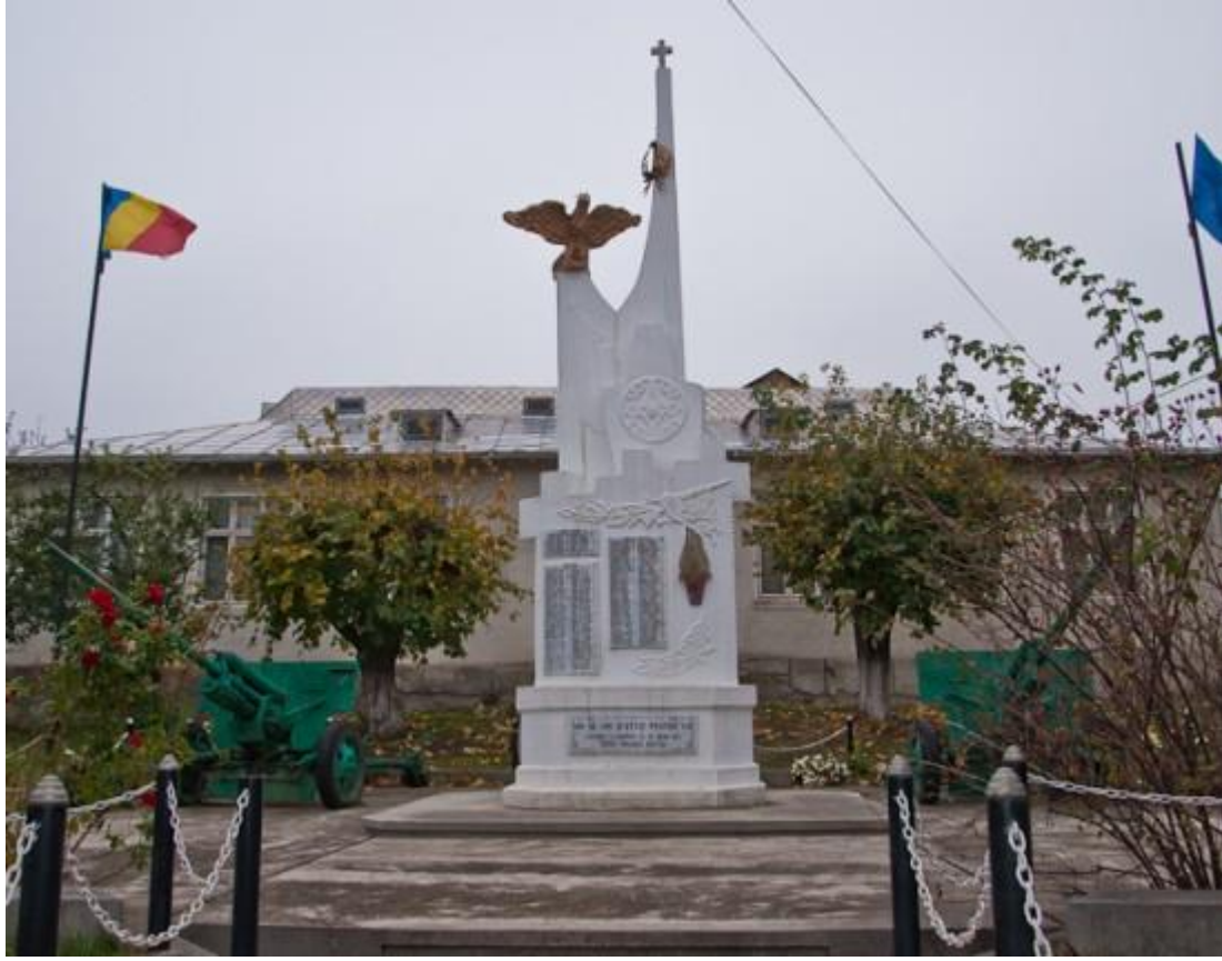
Monumentul Eroilor - Rădășeni