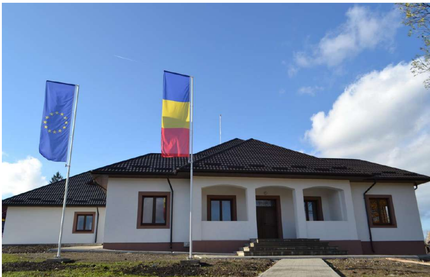
Caminiul Cultural Radaseni - modernizat

Activitățile desfășurate la Biblioteca comunală Radaseni au fost de un real interes . La aceste activități au participat un număr impresionant de utilizatori, pe viitor aceste activități vor continua și în anul 2020.